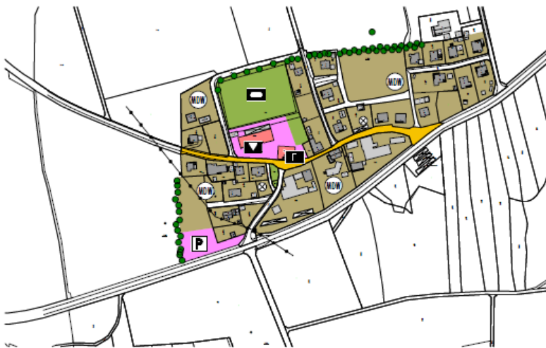
Deckblatt Nr. 13 M 1:5000